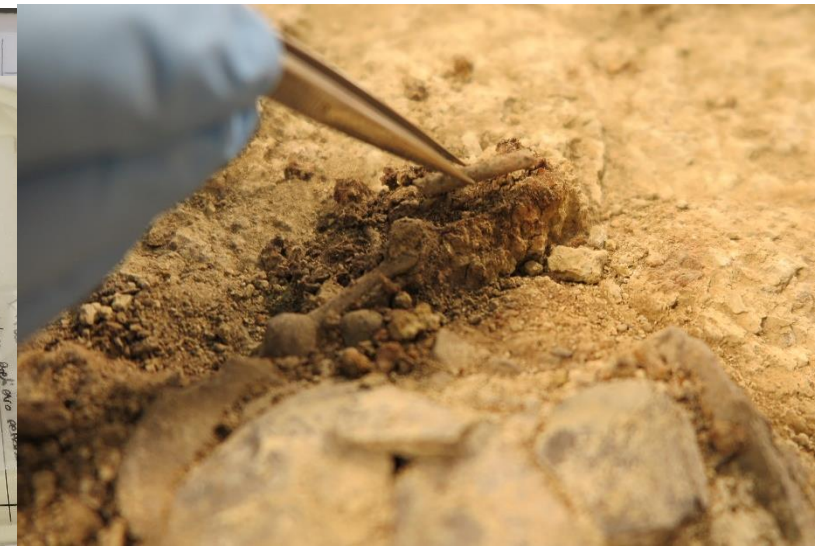
Prelievi di precisione