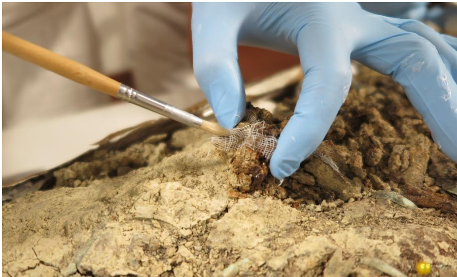
Velature con garza di cotone