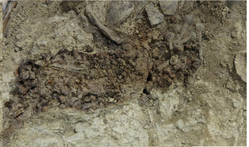
Difficoltà di riconoscimento dei reperti