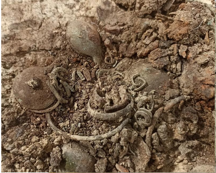
Situazioni complesse con gran numero di reperti